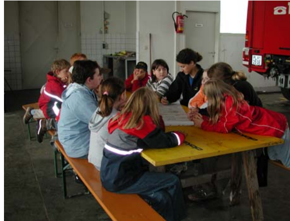
Die Spielforscher in Prinzersdorf