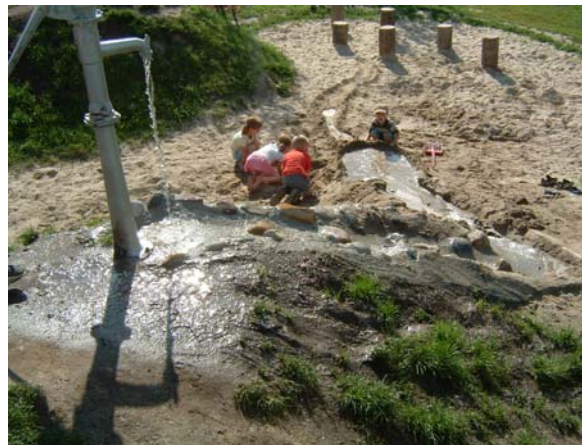
Beispiel eines Wasserlaufs mit Sandgrube