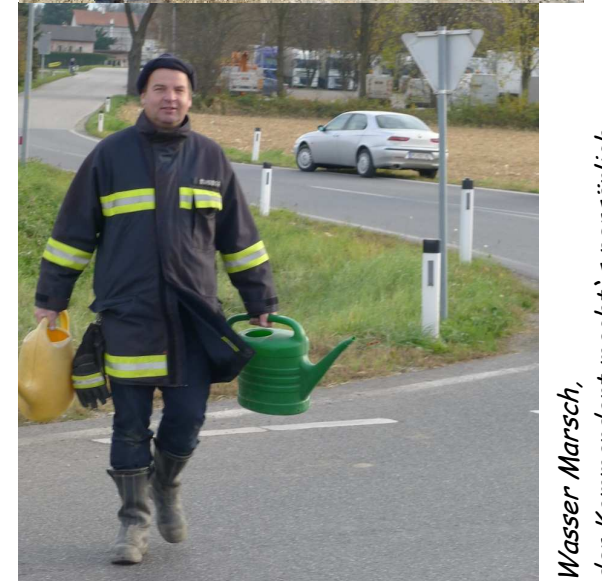
Wasser Marsch, der Kommandant macht`s persönlich